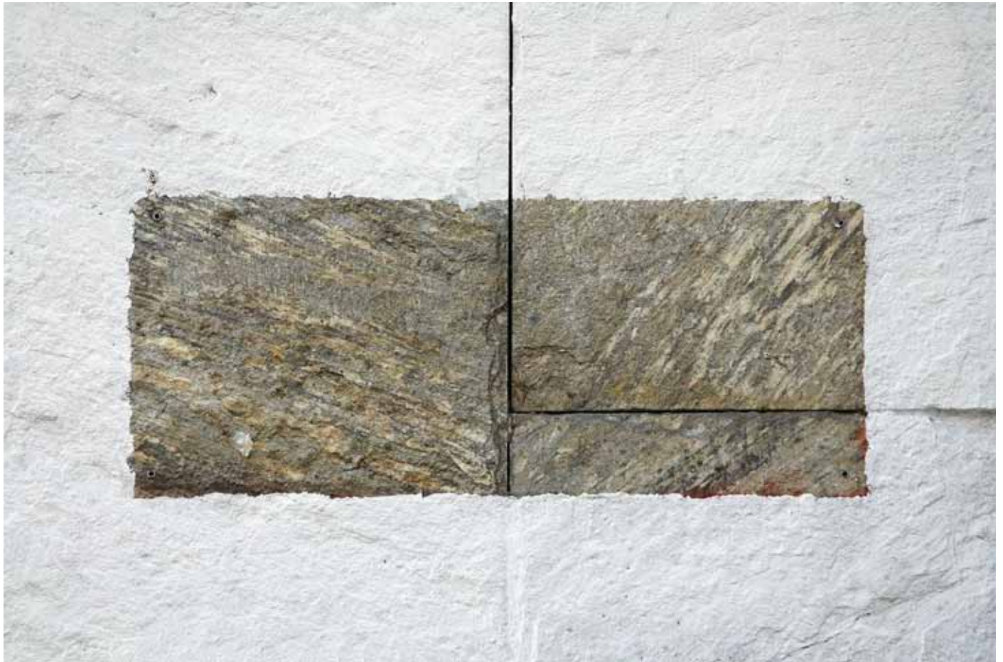
mur , 2013 photographie sur papier 89x129cm éd. 3+1 e.a.