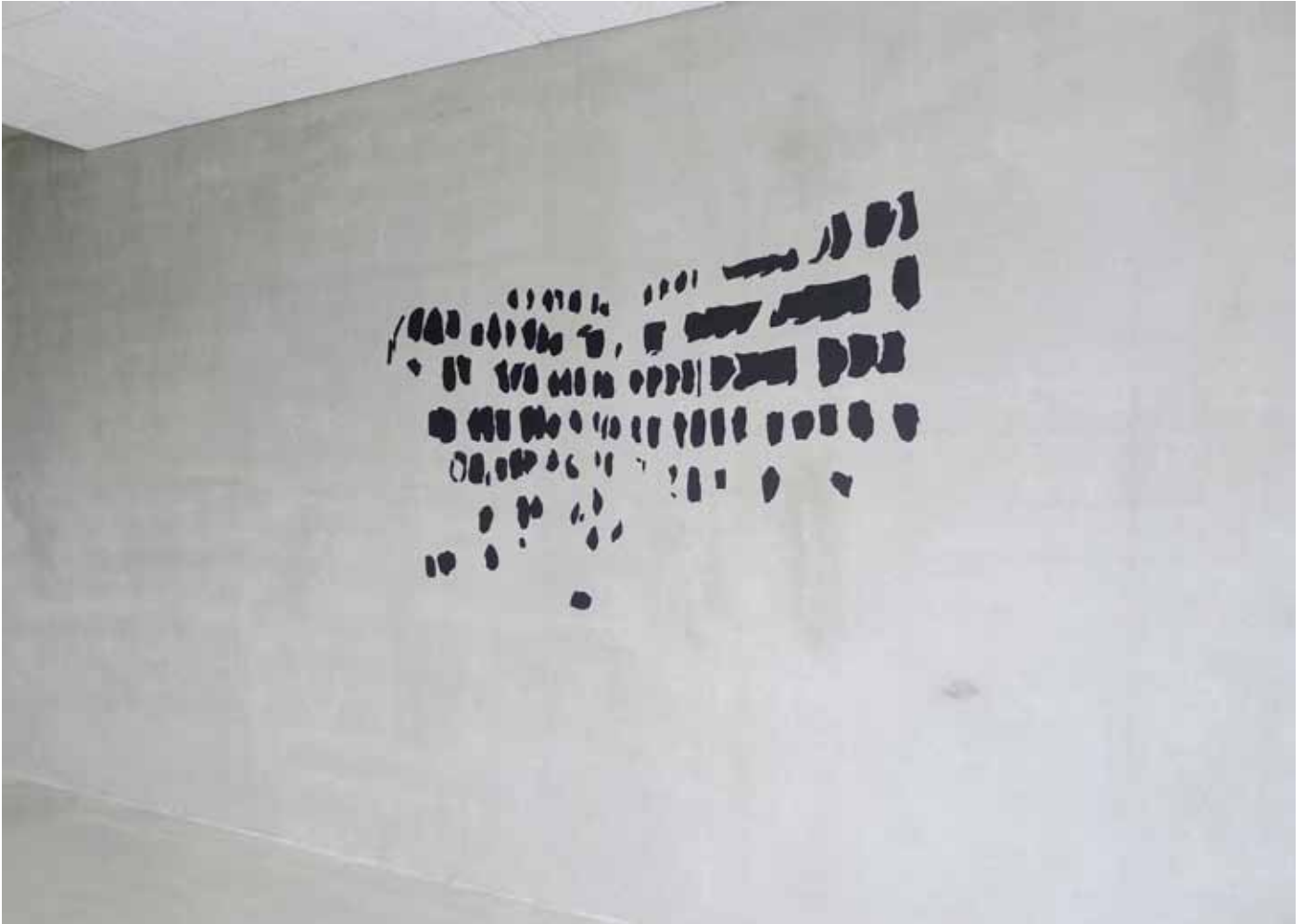
paroles , 2013 oxyde de fer, liant acrylique sur mur école polytechnique de Ulm