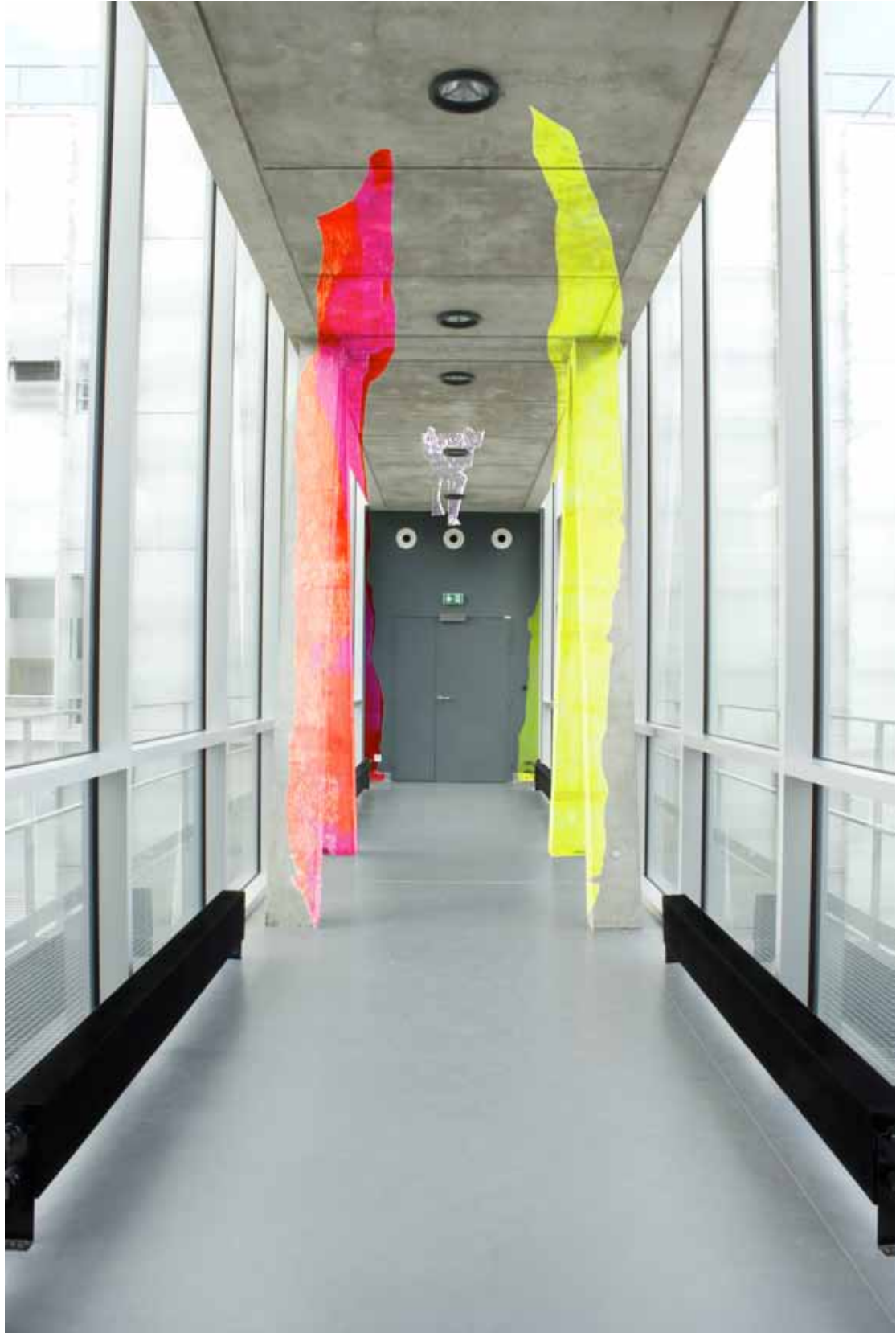
Sans titre (Série Lénapes) Acrylique sur papier et montage informatique Dimensions variables, 2014 © Mari Minato