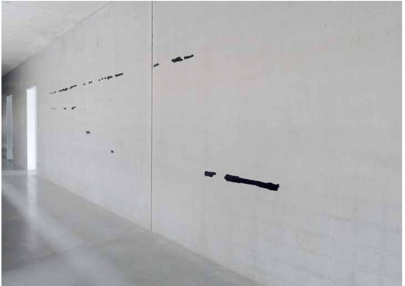
paroles , 2013 oxyde de fer, liant acrylique sur mur école polytechnique de Ulm