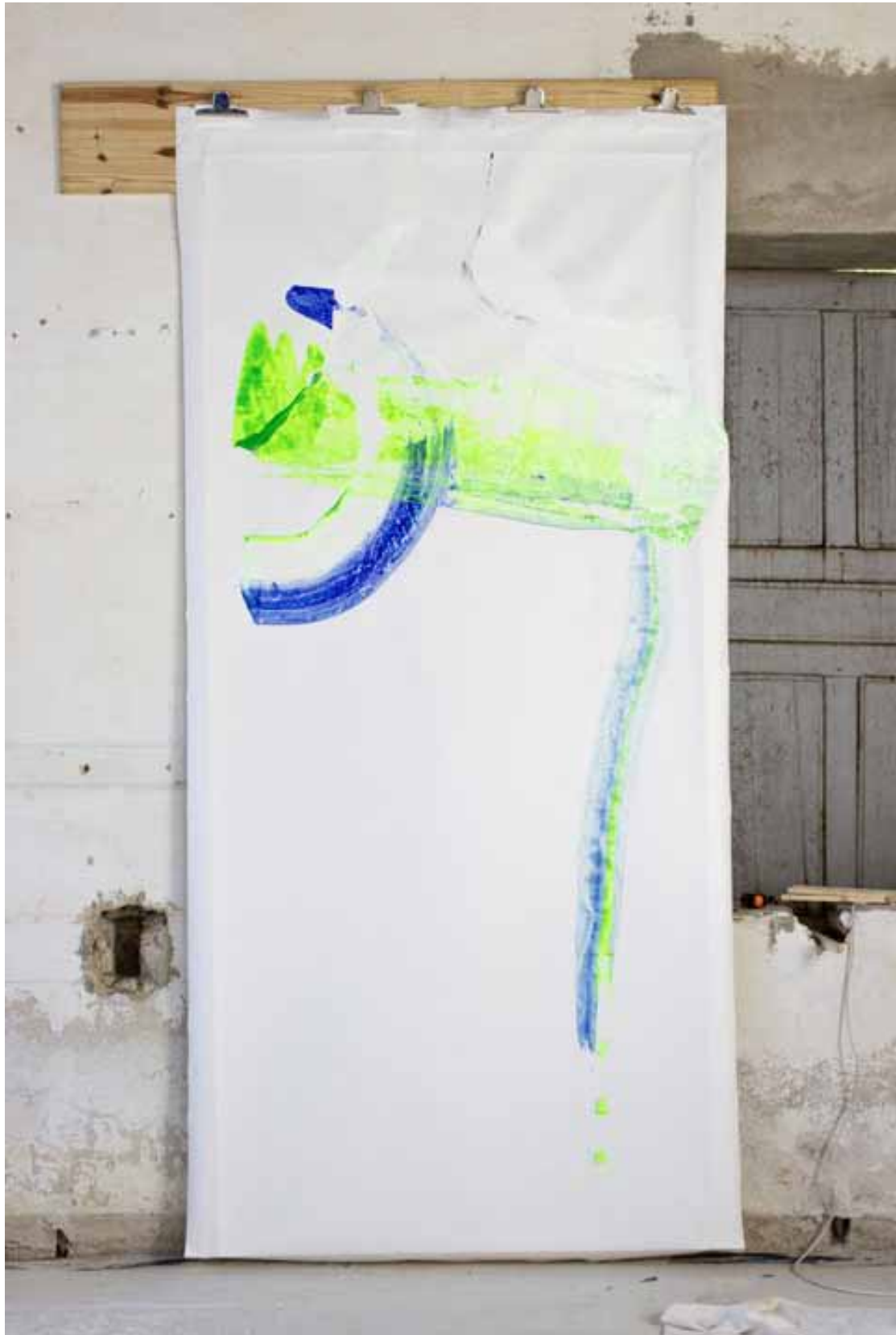
Sans titre (D'après Eileen Gray) Acrylique et peinture sur toile marouflée 300 x 150cm, 2013 © Mari Minato