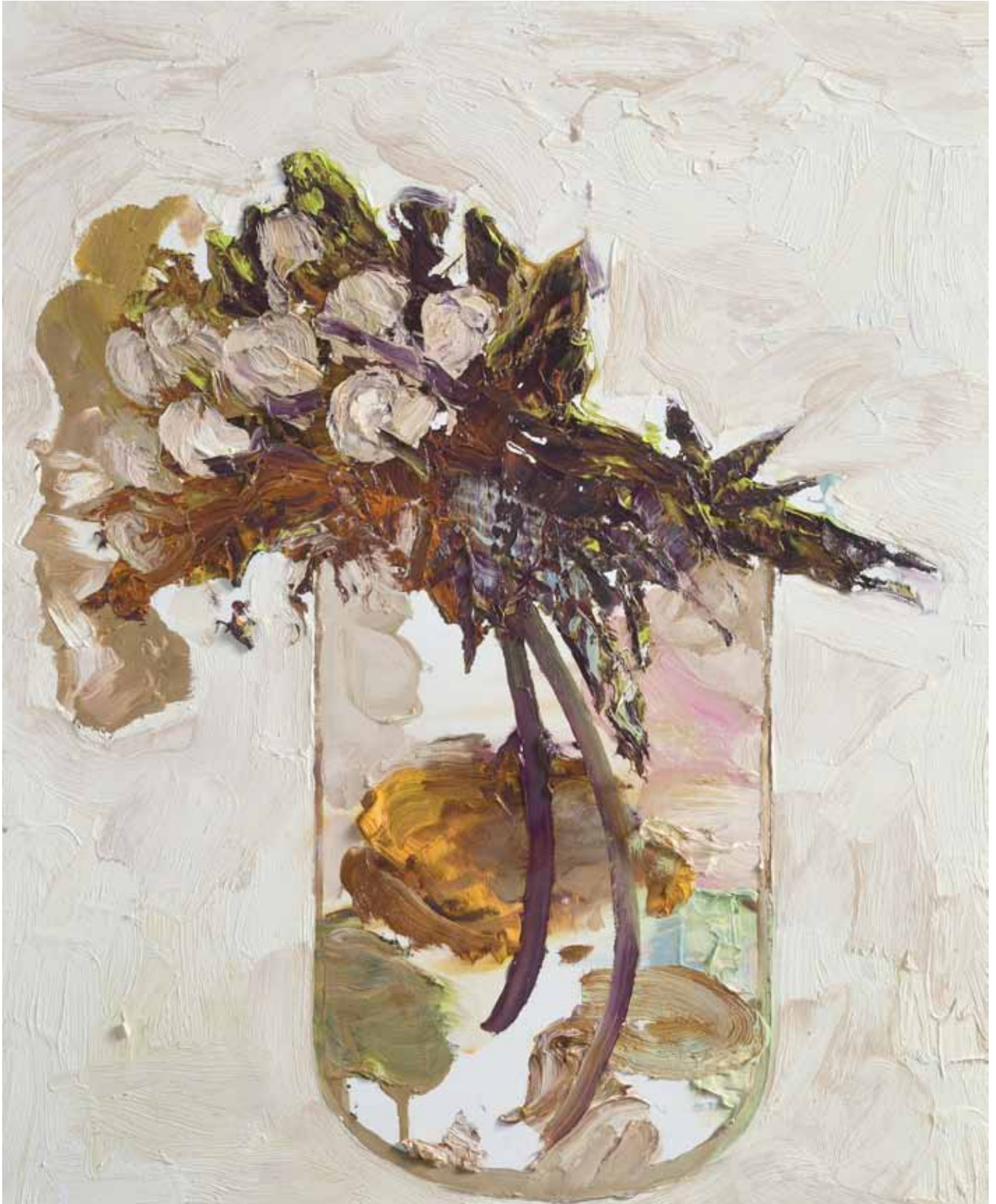
Sans titre , 61 X 50 cm, 2013 Huile sur toile