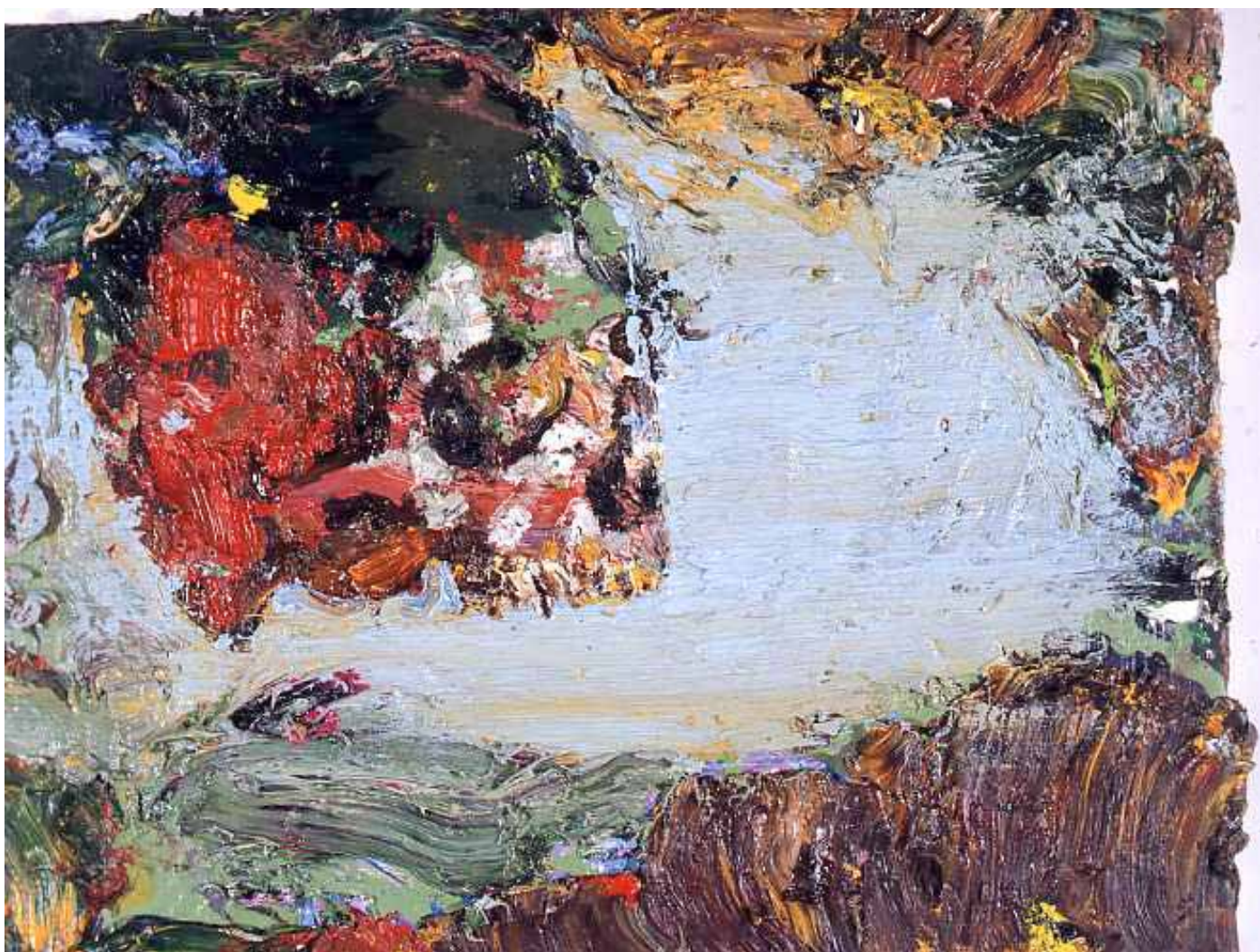
Sans titre , Huile sur toile. 27 x 35 cm , 2006