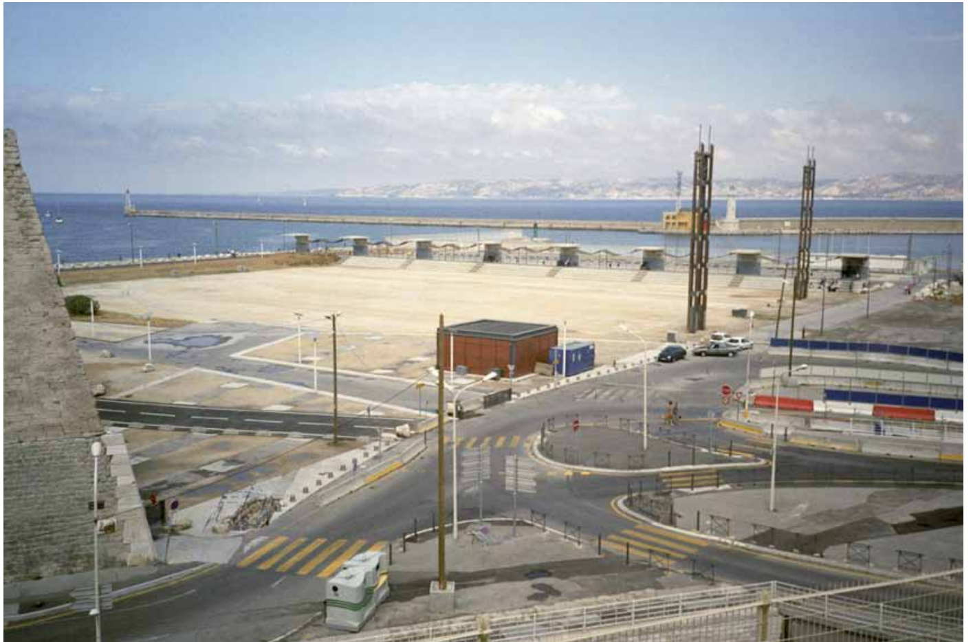
sans titre , 2001-2010 de la série M photographie