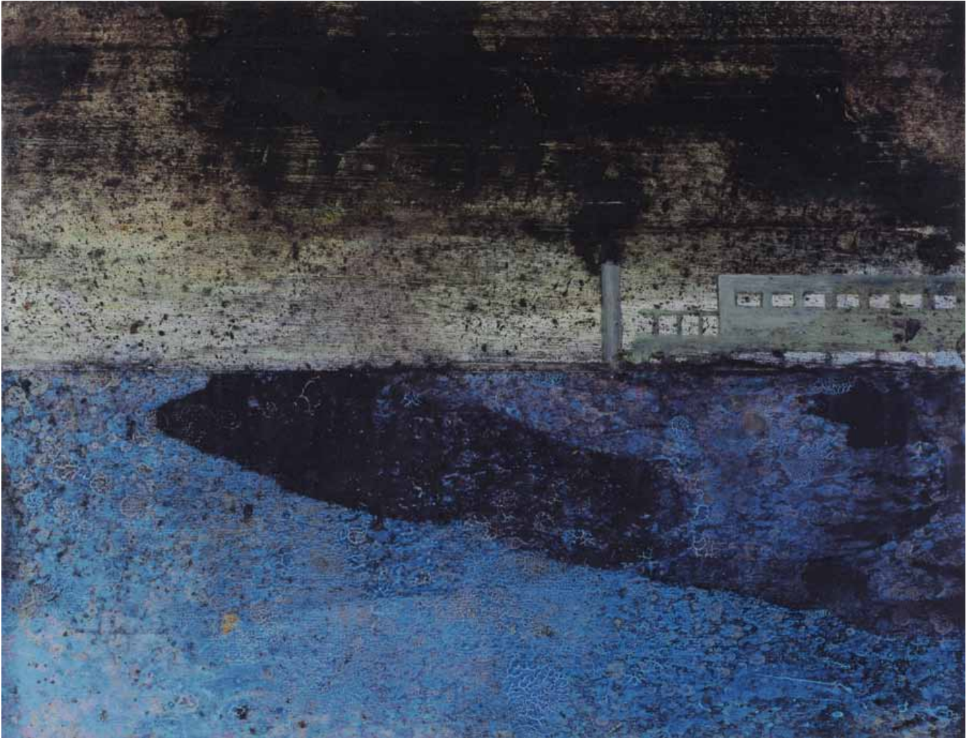
Paysage urbain , 33 x 43.2 cm. 2009 Huile et fusain sur carton