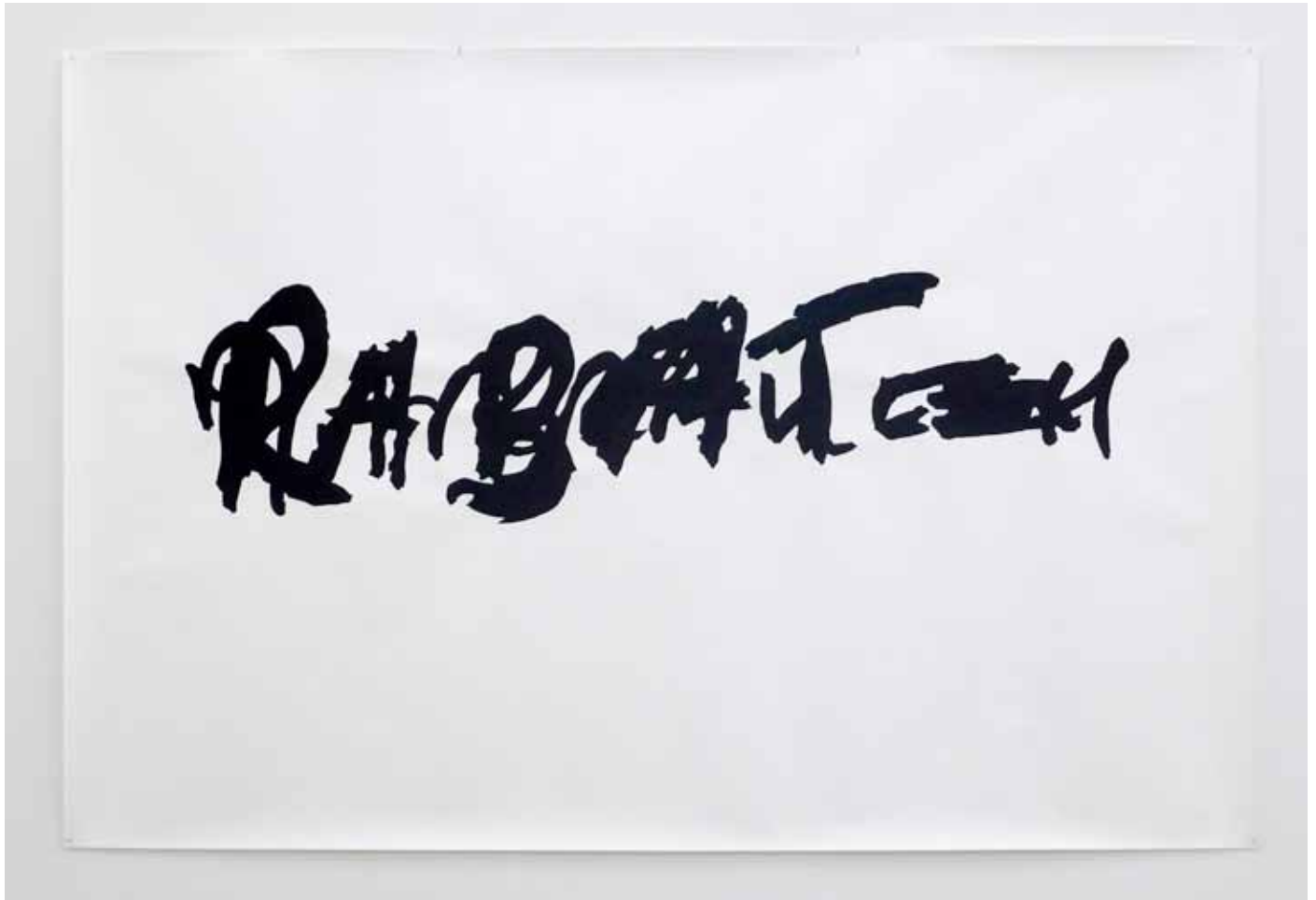
Rabat , 2014 paintmarker su papier 150 x 225 cm