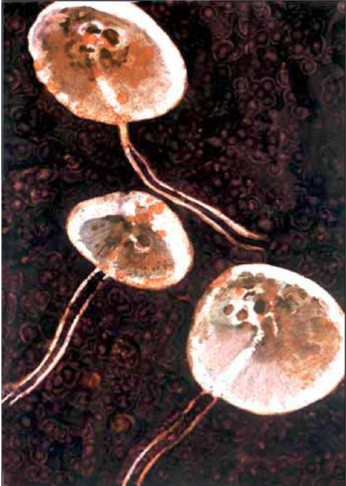
Denis Laget, Une émotion sans aucun progrès , 2005. Huile et fusain sur papier. 100 x 70 cm.